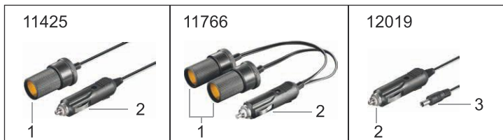
Fig.3: Operating elements