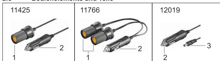
Fig.1: Bedienelemente und Teile